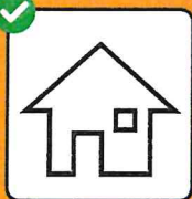
Per chi è positivo al test: isolamento. Per chi ha avuto contatti con una persona positiva al test: quarantena.