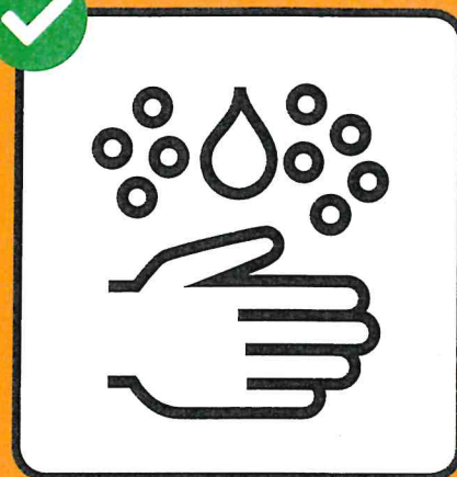
Lavarsi accuratamente le mani.