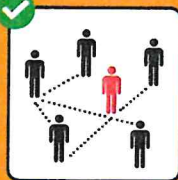
Fornire sempre i propri dati di contatto completi per il tracciamento.