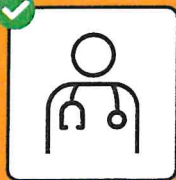
In caso di sintomi, fare immediatamente il test e restare a casa.