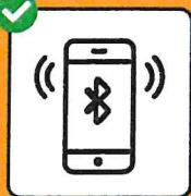
Per interrompere le catene di infezione: scaricare e attivare l'app SwissCovid.