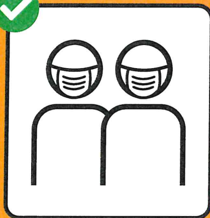
Usare la mascherina se non è possibile tenersi a distanza.